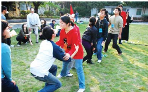
小小纸杯传递情缘