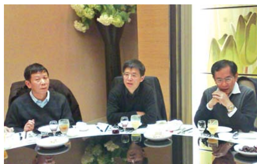
会长们共商基金发展大计