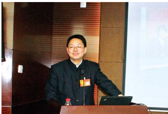
叶青校友做精彩演讲

2010年3月11日晚上7点，正值全国“两会”隆重召开之际，第十一届全国人大代表、湖北省统计局副局长叶青校友在百忙之中抽出时间回到母校，在中财大厦二层报告厅给校师生带来了一场主题为《“两会”代表解读“两会”经济热点》的精彩讲座。本次讲座由校友总会、统计学院、财政学院共同举办，讲座由统计学院刘扬院长主持。