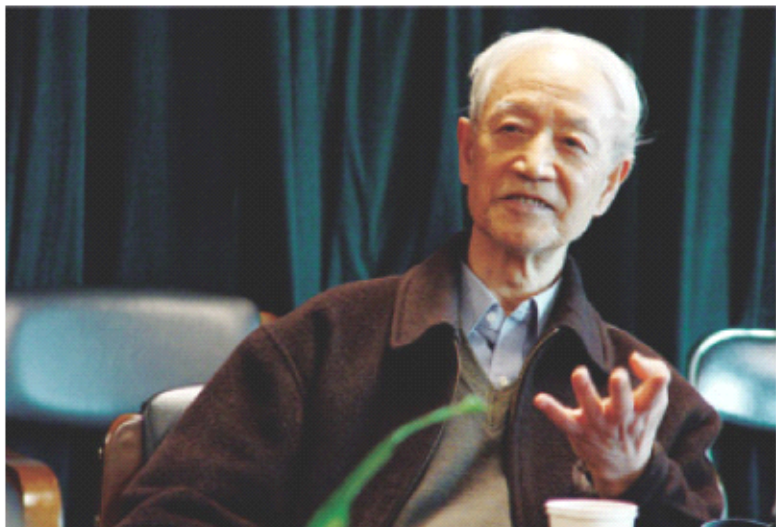
全国著名财政学家姜维壮教授