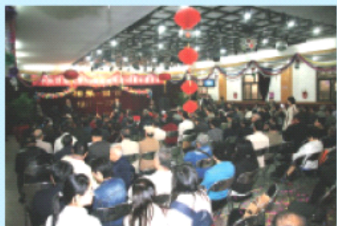
63级校友联谊会在校工会教职工活动中心举行

特别值得庆贺的是，本次83级校友的聚会出现了许多好的创意和举措：一是为感谢母校的培养，特别铸造赠送了高2.58米、基座宽2米、体现中财文化和历史传承的“中财宝鼎”；二是设计并发行了中央财经大学83级校友毕业20周年纪念邮票，提升了校友聚会的文化内涵；三是筹建成立了中央财经大学83级校友基金，用于支持学校的建设和发展、资助优秀和贫困