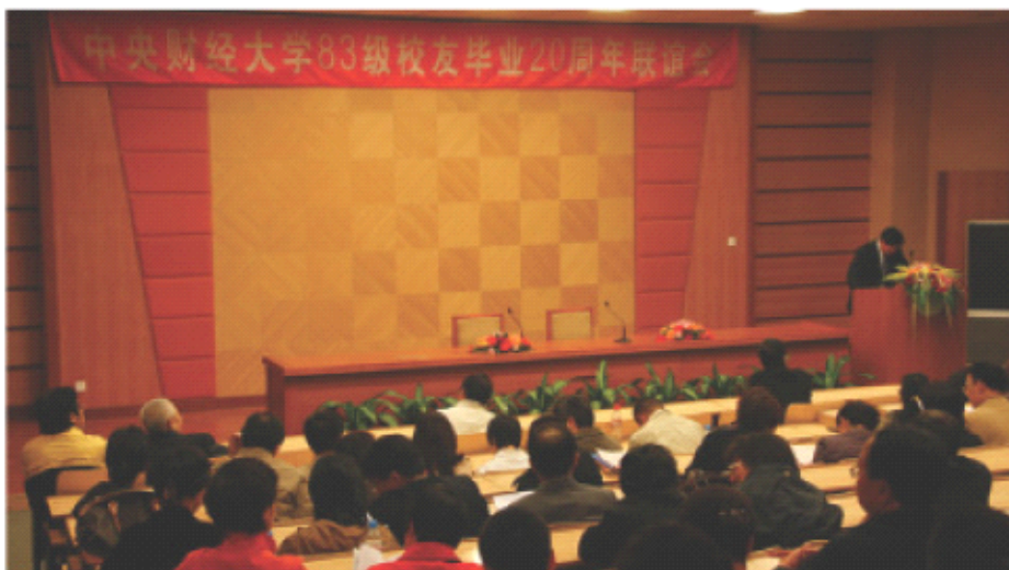
83级校友联谊会在学校学术报告厅举行

2007年10月13日,经过63、83两级校友联谊会筹备组、学校办公室和校友总会秘书处的精心筹划和周密准备,以及学校宣传部、团委、工会、后勤、保卫、基建、教务等职能部门的大力协助和积极配合,近300位63级和83级校友怀着无比激动和喜悦的心情,从祖国各地及海内外赶赴母校,分别参加63级校友毕业40周年和83级校友毕业20周年联谊活动。