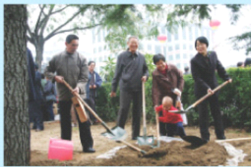
63级校友参加植树活动