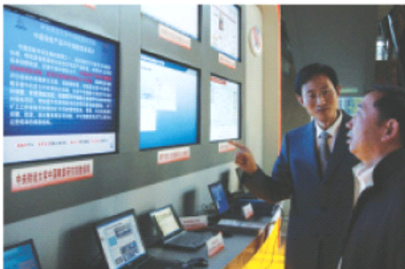
袁振国司长与袁贵仁副部长在观看中国精算研究院数据库演示