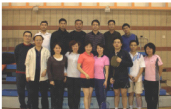
参赛的老师和同学合影

校羽毛球协会沟通和交流的目的。参赛的同学纷纷表示，希望以后类似的交流活动多举办几次。