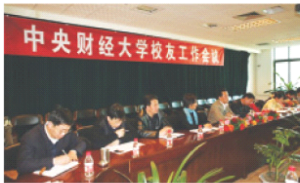
校友工作会议现场

作提出了要求：要高度重视、做好校友工作，尽全力为其提供支持、创造条件。要努力搭建“母校关怀校友，校友支持母校”的互动平台，不断推动校友、母校的密切联系和互助发展，有组织地开展校友工作，建立起良好的合作机制，实现共赢目标。