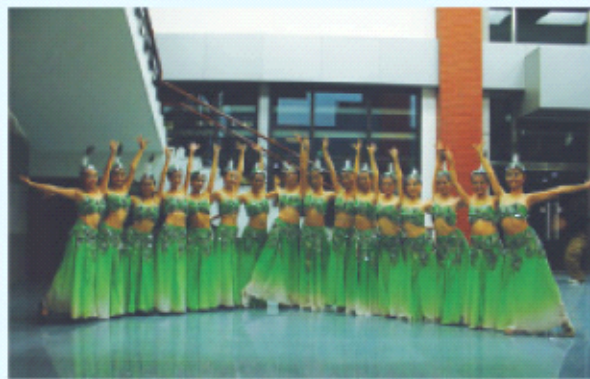
我校参赛舞蹈《嘎洛诺》全体演员合影

其中，舞蹈团的民族舞《嘎洛诺》表现尤为优异，获得了舞蹈组二等奖，来自舞蹈团的16名团员重新演绎了中财这支经典的孔雀舞。舞蹈团的街舞《Street life》获得了舞蹈组三等奖；合唱团的团员们凭借小合唱《相逢是首歌》和《在银色的月光下》，夺得了声乐组三等奖。由话剧团选送的短剧《七彩大一》和《破茧》分别是由星火社和高学院的同学